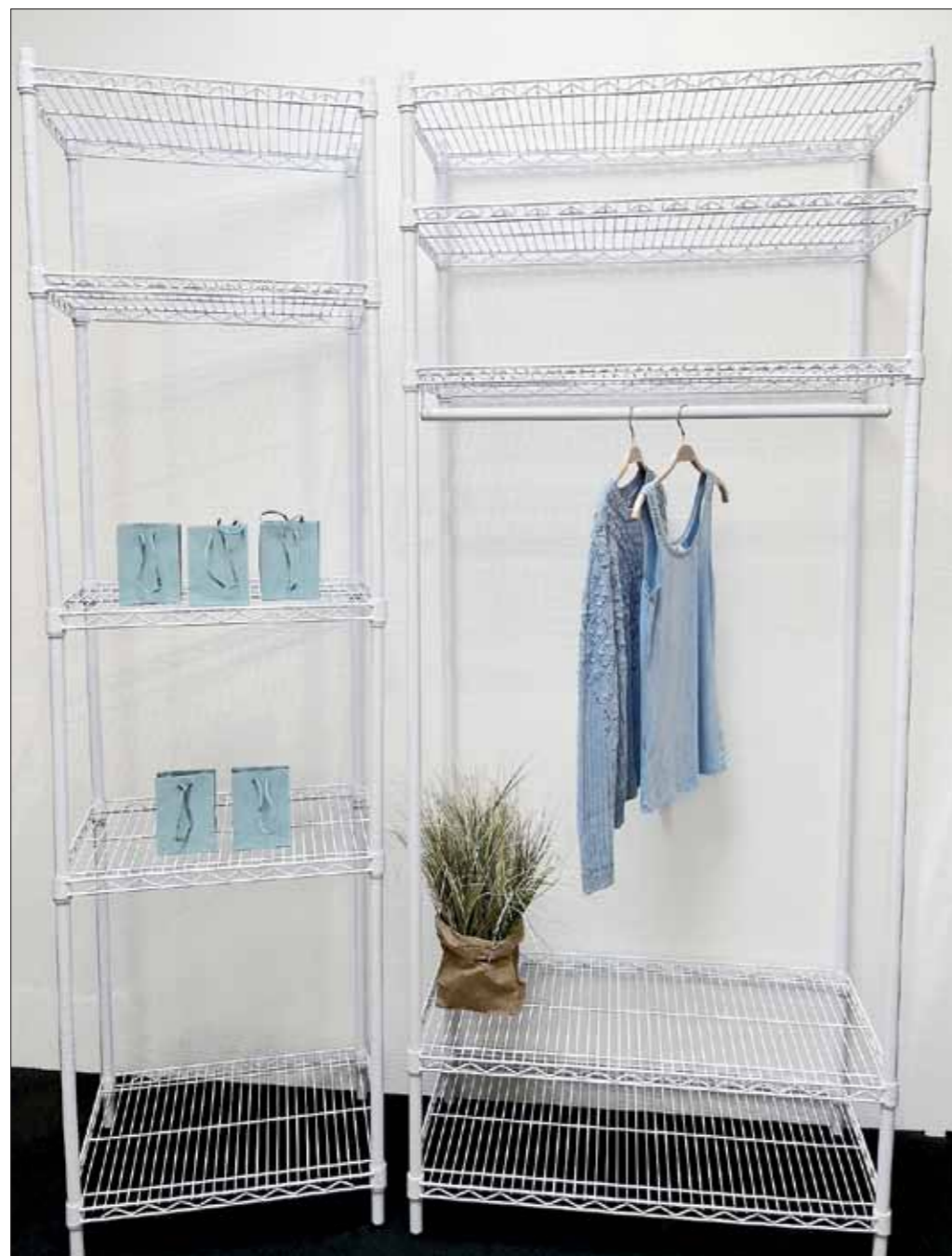
Her er vist reol med garderobestang